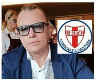
A cura di IVANO CARRARO (Treviso)

ivano.carraro@dconline.info * Cell. 377 353 6924 *